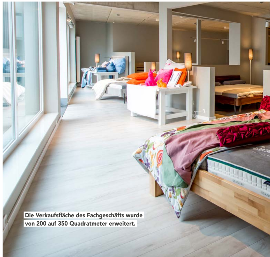
Die Verkaufsfläche des Fachgeschäfts wurde von 200 auf 350 Quadratmeter erweitert.

Er kennt das Geschäft und die Besonderheiten der Region Ostwestfalen-Lippe, Münster