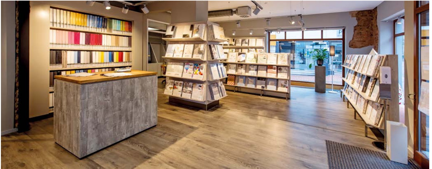
Hell und modern präsentiert sich die Verkaufsfläche nach einem grundlegenden Umbau.