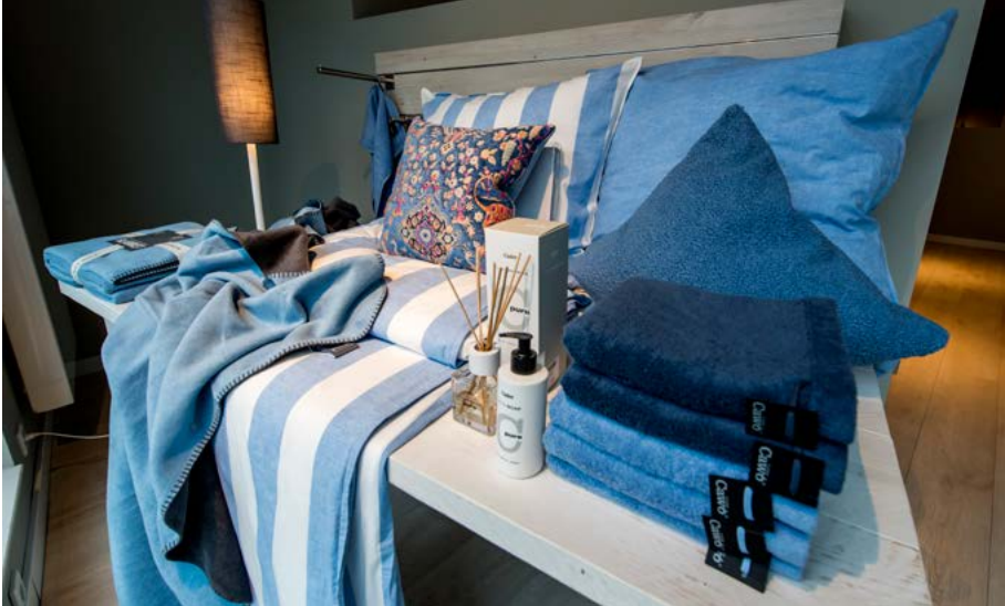
Jeder einzelne Bereich des Geschäfts ist mit viel Liebe zum Detail dekoriert.