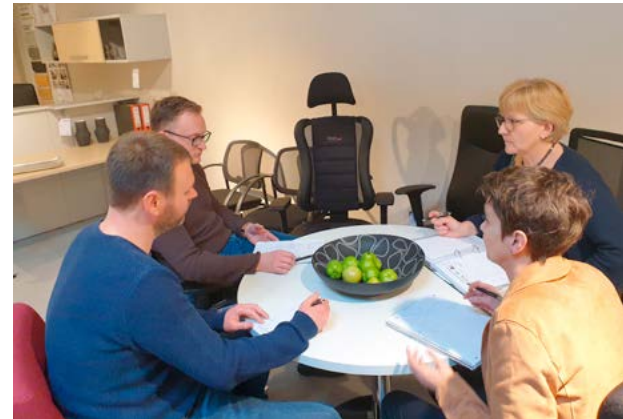
Die Theorie eigneten die Teilnehmer des neuen Ausbildungsprogramms sich auch in Gruppenarbeit an.